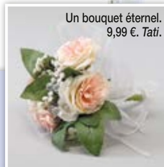
Un bouquet éternel. 9,99 €. Tati.

Chemise Oxford en coton, à partir de 27,90 €. Gilet, à partir de 29,90 €. Pantalon en lin, à partir de 32,90 €. Chapeau, 19,90 €. Cyrillus.