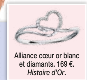
Alliance cœur or blanc et diamants. 169 €. Histoire d'Or.

Version courte pour cette robe ivoire avec jupon intégré. Fermeture dos avec boutons recouverts. Modèle M lle Inès. 425 €. Pronuptia.