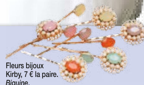
Fleurs bijoux Kirby, 7 € la paire. Biguine.

Robe bustier en dentelle de Calais, jupe ample et fluide composée de multiples cercles en tulle souple, taille soulignée d'une ceinture drapée. A partir de 1500 €. Modèle Istoua, Cymbeline.