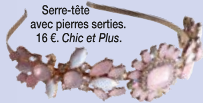
Serre-tête avec pierres serties. 16 €. Chic et Plus.

Jupon-bustier recouvert d'un voile parsemé de petites fleurs. 74,95 €. Molly Bracken.