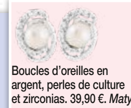
Boucles d'oreilles en argent, perles de culture et zirconias. 39,90 €. Maty.

Pince fleur en strass. 14,50 €. Chic et Plus.