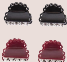
mini-pinces dentelle PVC : 4,50 €