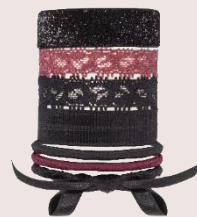
élastiques assortis PVC : 4,50 €