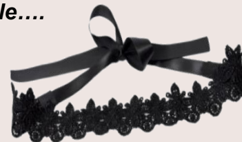
headband dentelle PVC : 5,50 €