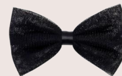
barrette nœud tulle PVC : 4,90 €