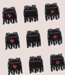
mini-pinces strass PVC : 4,50 €