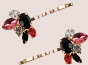
pince-guiches précieuses PVC : 3,90 €